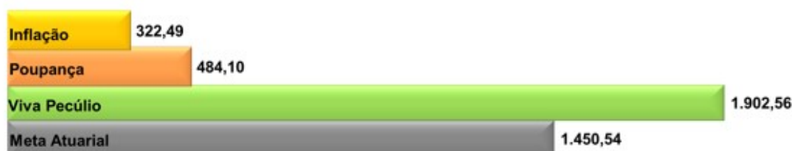
Rentabilidade acumulada (%) - (Jan/98 - Nov/22)