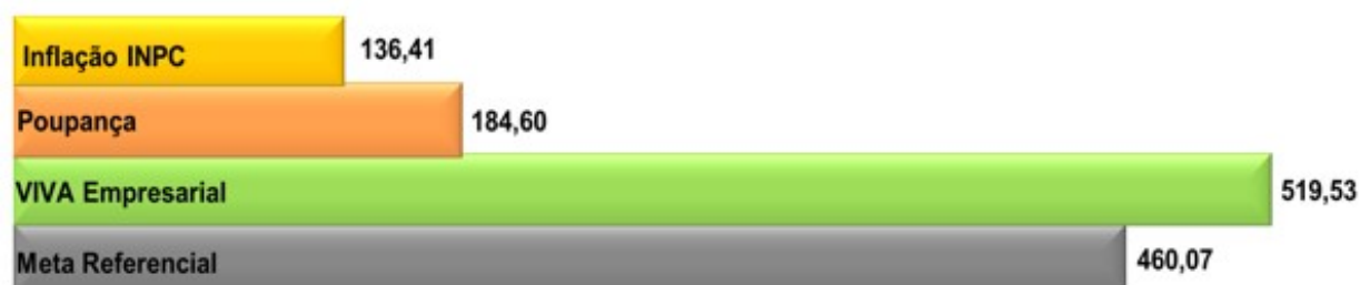
Rentabilidade acumulada (%) - (Jun/05 a Nov/22)